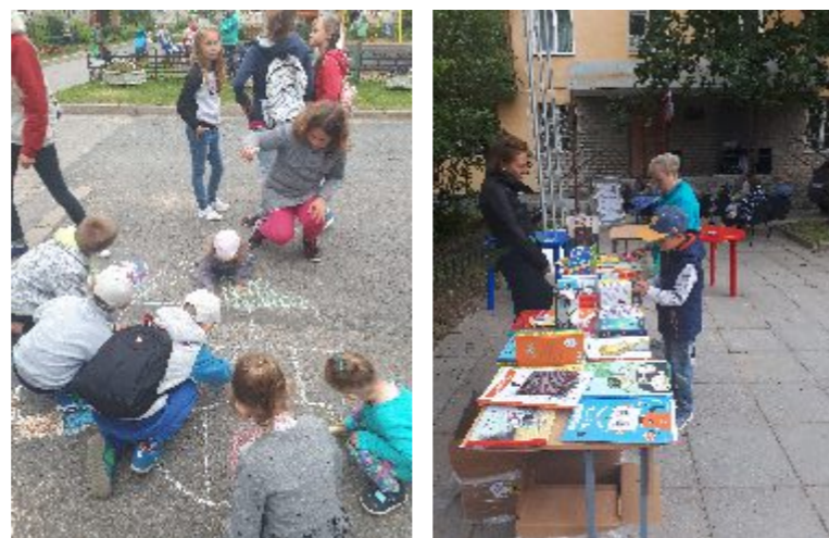
На фото - семейный праздник «Читать - это модно»

В помещении администрации МО п. Молодёжное, по адресу: п. Молодёжное, ул. Правды, 5, библиотекой им. Зощенко совместно с муниципальным образованием п. Молодёжное организован бесплатный свободный не прямой обмен книгами. Здесь можно оставить книги из домашней библиотеки и взять понравившиеся издания. Приглашаем посетить книжный фримаркет, который открыт в часы работы местной администрации.