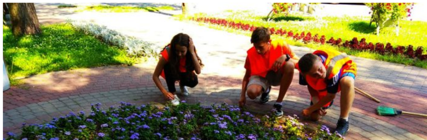
На фото - трудоустройство несовершеннолетних

В соответствии с вопросом местного значения: участие в организации временного трудоустройства несовершеннолетних в возрасте от 14 до 18 лет в свободное от учёбы время, местной администрацией МО п. Молодёжное трудоустроено 5 подростков, которые работают на территории посёлка.