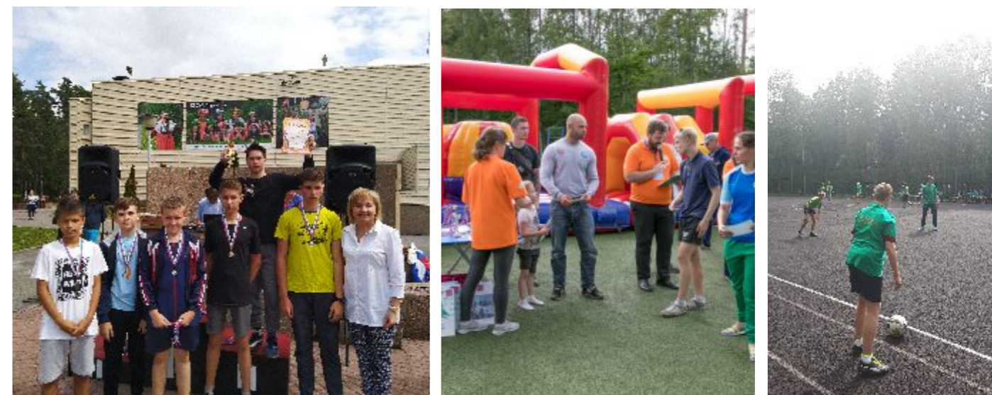
На фото - соревнования по волейболу

11 июля 2018 года в п. Смолячково состоялись межмуниципальные соревнования по мини-футболу и волейболу на кубок им. Ф.А. Смолячкова. Футбольная команда п. Молодёжное заняла 2 место в соревнованиях.