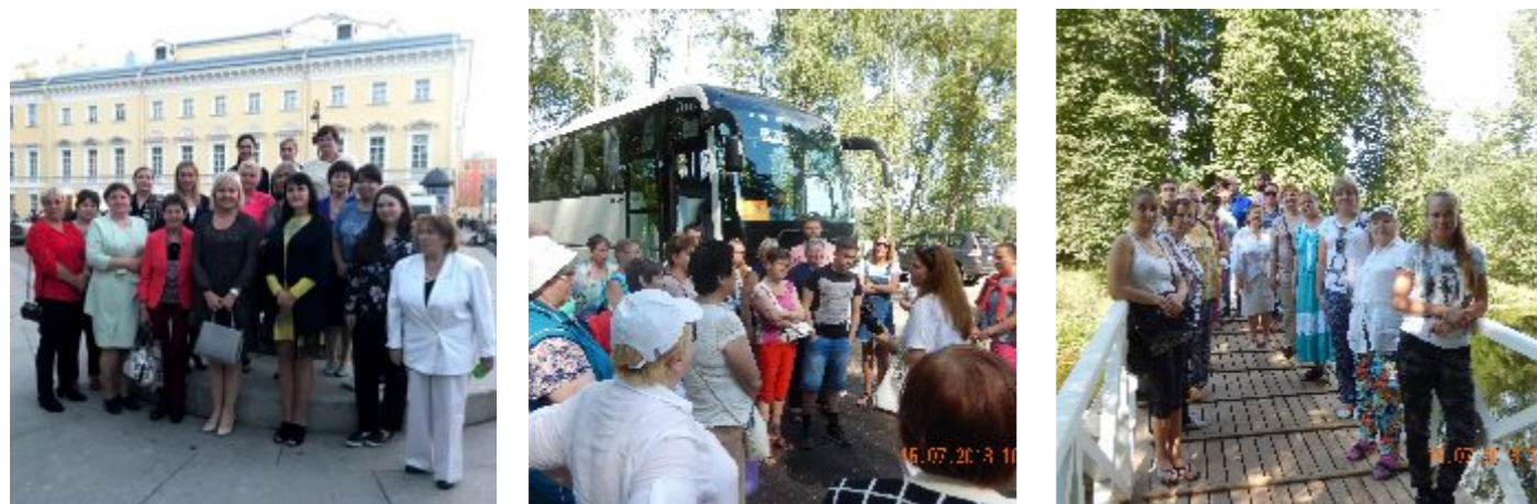
На фото - выездные мероприятия

14 - 15 июля экскурсионная поездка в Псков и Пушкинские горы.