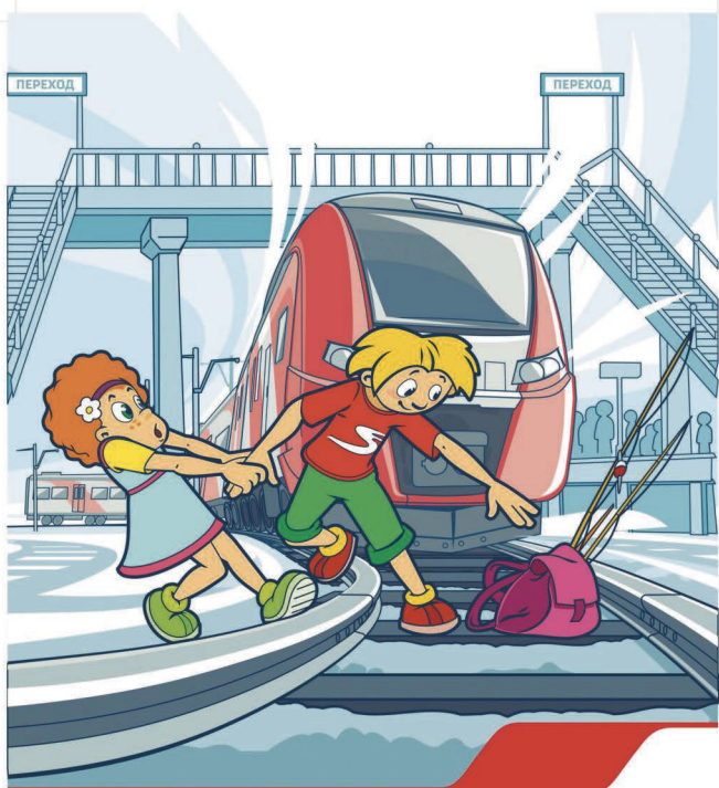
Нельзя переходить пути в неполюженном месте!