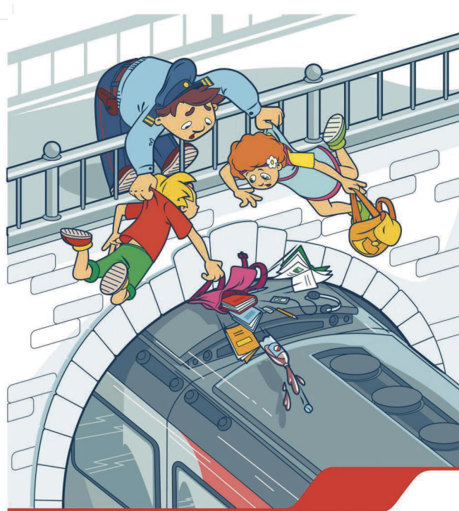
Проезд на крышах и подножках поездов – может стоить жизни!