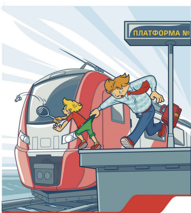
Платформа – не место для игр!