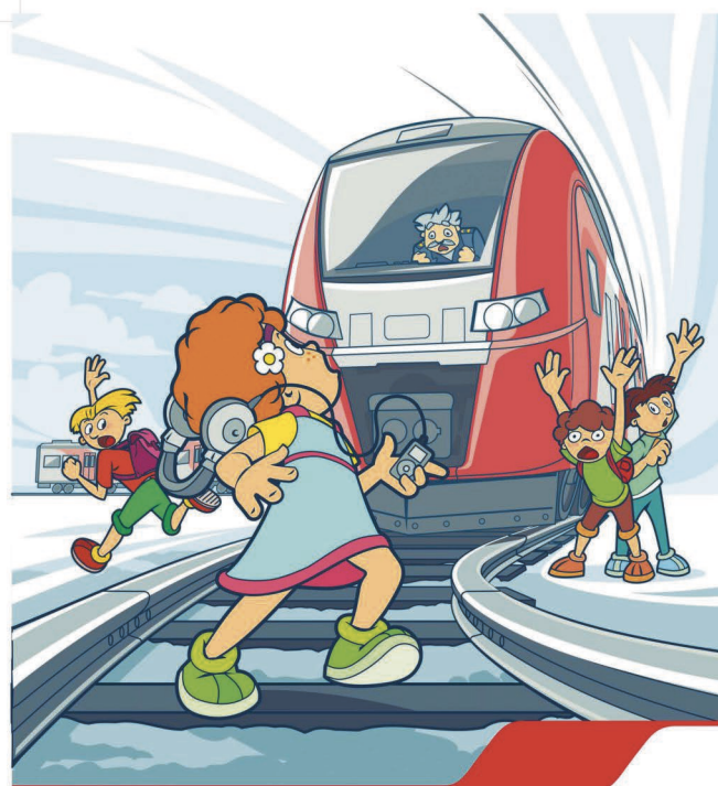
Плеер и железная дорога - несовместимы!